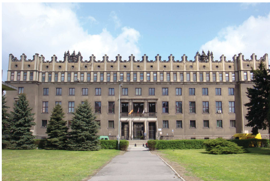
Ilustracja 4. Budynek „S” Centrum Administracyjnego kombinatu