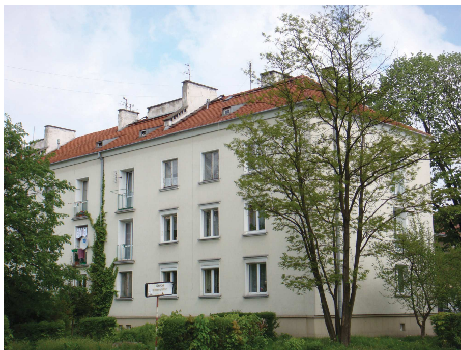
Ilustracja 1. Pierwszy blok w Nowej Hucie, osiedle Wandy 14, fot. Jarosław Kłaś, 2011

miasta ogrodu oraz zabudowy warszawskiego Mariensztatu. Zabudowa uwzględniała stary cmentarz mogiński, położony przy obecnej alei Jana Pawła II 18 .