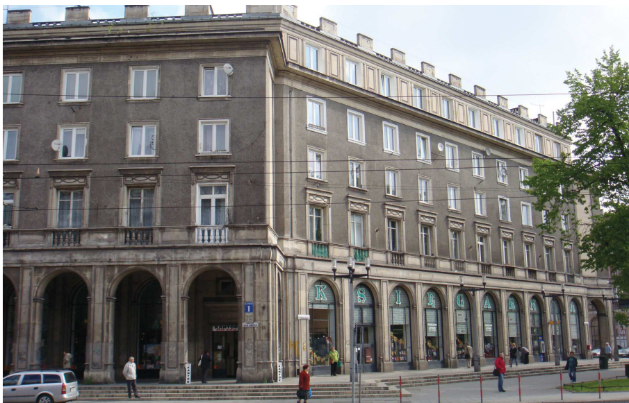
Ilustracja 2. Fragment zabudowy wokół placu Centralnego, osiedle Centrum C, fot. Jarosław Klaś, 2011

zygnowano z wielu zaplanowanych elementów. Najpełniej założenia socrealizmu uosabiała architektura wokół placu Centralnego (il. 2) i w najbliższym mu odcinku alei Róż (J. Ingarden, T. Ptaszycki, 1952–1956), nawiązująca do wczesnego renesansu, baroku i klasycyzmu. Typowymi elementami tej zabudowy są: podział elewacji na trzy części, ryzality flankujące bryły, boniowanie w strefie cokołowej, arkady podcieniowe w parterach, porte-fenêtre pierwszego piętra, gzymsy i attyki. Centralny charakter, choć peryferyjne usytuowanie ma osiedle Szkolne z monumentalnymi budynkami szkół i attykami nawiązującymi do renesansu. Od 1954 roku budowano osiedle Stalowe, położone po przeciwnej stronie alei Solidarności. Wyróżnia się ono monumentalnością, gzymsami, bogatymi dekoracjami i detalami. Tam też po raz pierwszy na szeroką skalę zastosowano tak zwany pierwszy stopień uprzemysłowienia, polegający na stosowaniu elementów prefabrykowanych przy budowie poziomych części budowli (stropy, dachy, klatki schodowe itd.). Architektura budowanego pod koniec etapu socrealistycznego (od 1954) osiedla Młodości na powrót nawiązuje do form kameralnych i rodzimych. Wzniesione nieco później osiedla Hutnicze, Słoneczne i Uroczę noszą już tylko znamiona architektury historycznej 19 .