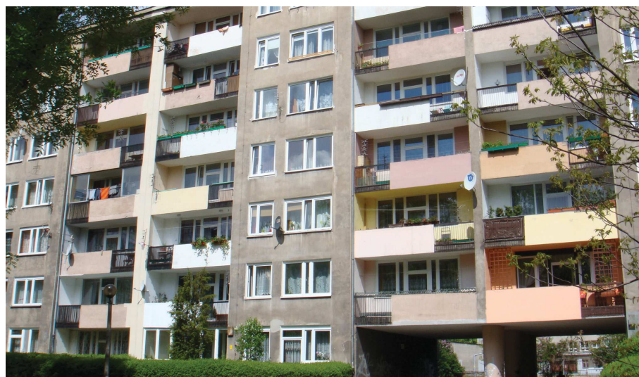
Ilustracja 3. Fragment tak zwanego bloku szwedzkiego, osiedle Szklane Domy, fot. Jarosław Kłaś, 2011

siera i uproszczonej idei Bauhausu. Pierwszym w tym stylu był tak zwany blok szwedzki (il. 3) z kolorowymi tynkami na osiedlu Szklane Domy, ukończony w 1959 roku (M. i J. Ingardenowie) 20 . Inne realizacje to tak zwany blok francuski na osiedlu Centrum B (K. Chodorowski, 1957), blok „helikopter” (osiedle Centrum D, 1957) i osiedla w południowo-zachodniej części Nowej Huty: Handlowe, Kolorowe i Spółdzielcze (sektor D) 21 . Bloki rozmieszczono tam swobodnie, zrywając z dotychczas obowiązującą obrzeżną zabudową ulic 22 i zestawiając ze sobą budynki wysokie oraz długie i niskie (układy punktowe i linijkowe, niekiedy kulisowe). Osiedla sektora D cechuje staranne dopracowanie przestrzeni międzyblokowej, pawilony handlowo-usługowe i komponowana zieleń. Pojedyncze obiekty w nowym stylu powstawały także na starszych osiedlach. Odejście od realizmu socjalistycznego przejawiało się również budową osobnych obiektów handlowo-usługowych. Od początku lat sześćdziesiątych wprowadzono tak zwany drugi stopień uprzemysłowienia – zarówno części poziome, jak i pionowe budowli (np. ściany nośne) wznoszono z użyciem elementów prefabrykowanych. Lata osiemdziesiąte przyniosły realizację budynków w południowej części placu Centralnego: Nowohuckiego Centrum Kultury (Z. Pawelski) i postmodernistycznego osiedla Centrum E (R. Loegler, 1987–1994) 23 .