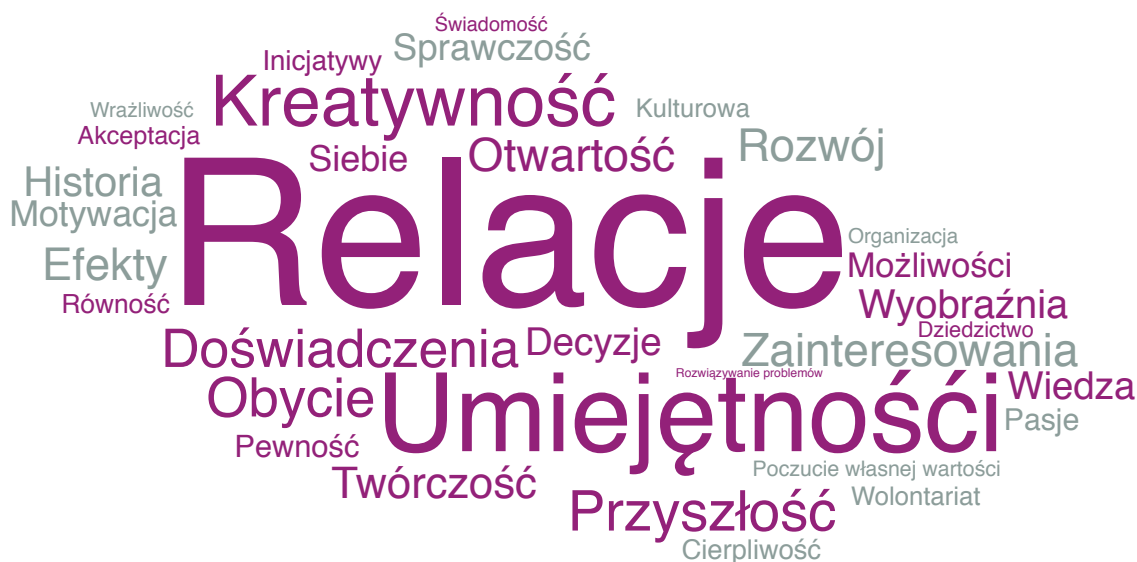
Obraz 1. Chmura słów: Korzyści związane z obcowaniem z kulturą według dorosłych rozmówców.

Pracowniczka pozaszkolnej instytucji oświatowej